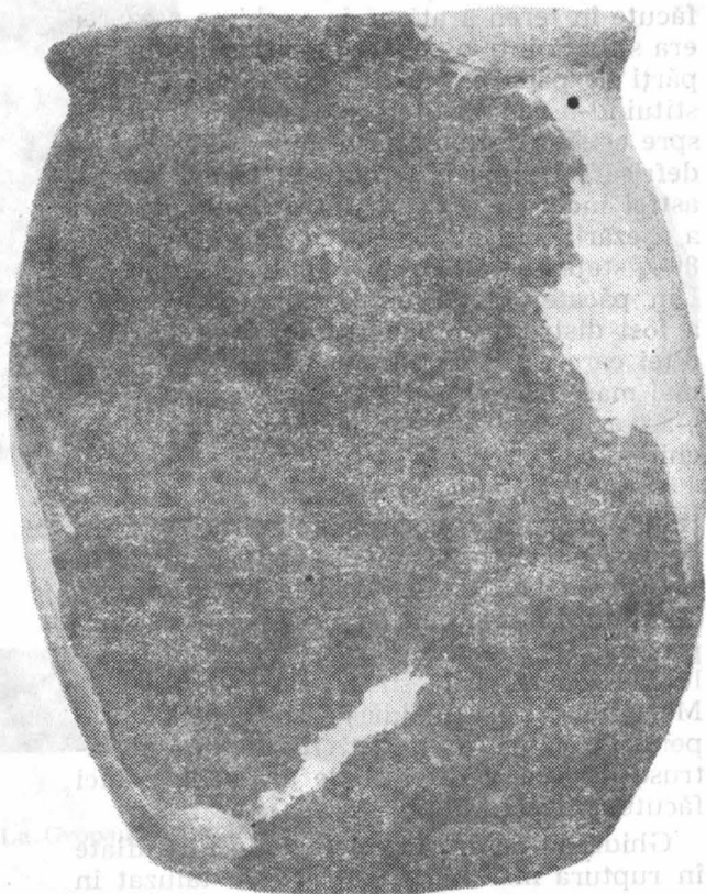
Fig. 1. Colonești-Guești. Vas de lut de tip Ipotești-Ciurelu.

În partea de nord-vest a încăperii se afla cuptorul a cărui carcasă a fost realizată din